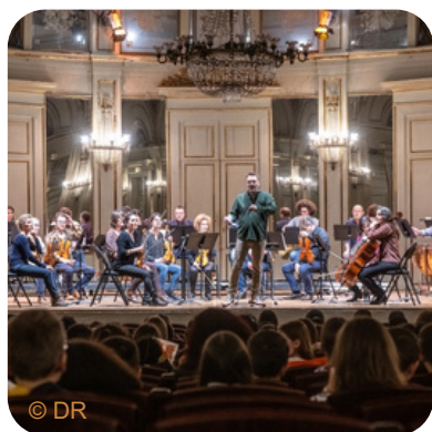
Concert commenté, la danse macabre devant près de 1000 scolaires

L'Orchestre Symphonique d'Orléans s'engage activement dans l'accueil et l'inclusion de divers publics. En 2024, l'OSO a reçu 1000 élèves lors de répétitions, favorisant ainsi l'éducation musicale. Par ailleurs, en collaboration avec le Centre Communal d'Action Sociale (CCAS), l'orchestre a également ouvert ses portes à des seniors orléanais, leur permettant de vivre des expériences culturelles enrichissantes. De plus, l'OSO s'investit dans l'accès à la culture pour les personnes éloignées, grâce à son partenariat avec l'association « Culture du Cœur ». Enfin, l'orchestre offre des opportunités de stage et d'alternance à des jeunes en formation, y compris ceux en Service National Universel (SNU), contribuant ainsi à leur développement professionnel et artistique.