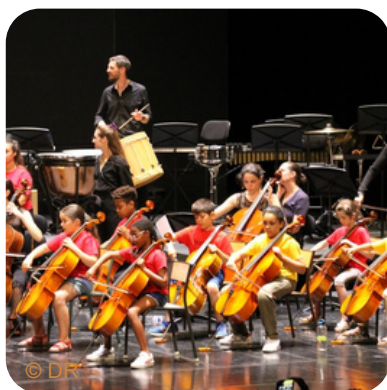
Orchestre Démon Orléans Val de Loire en partenariat avec la Philharmonie de Paris