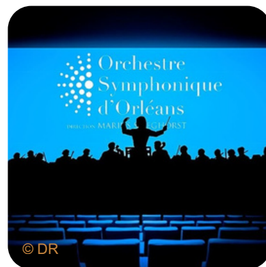
Reportage sur l'OSO produit par des étudiants de l'ISC Paris